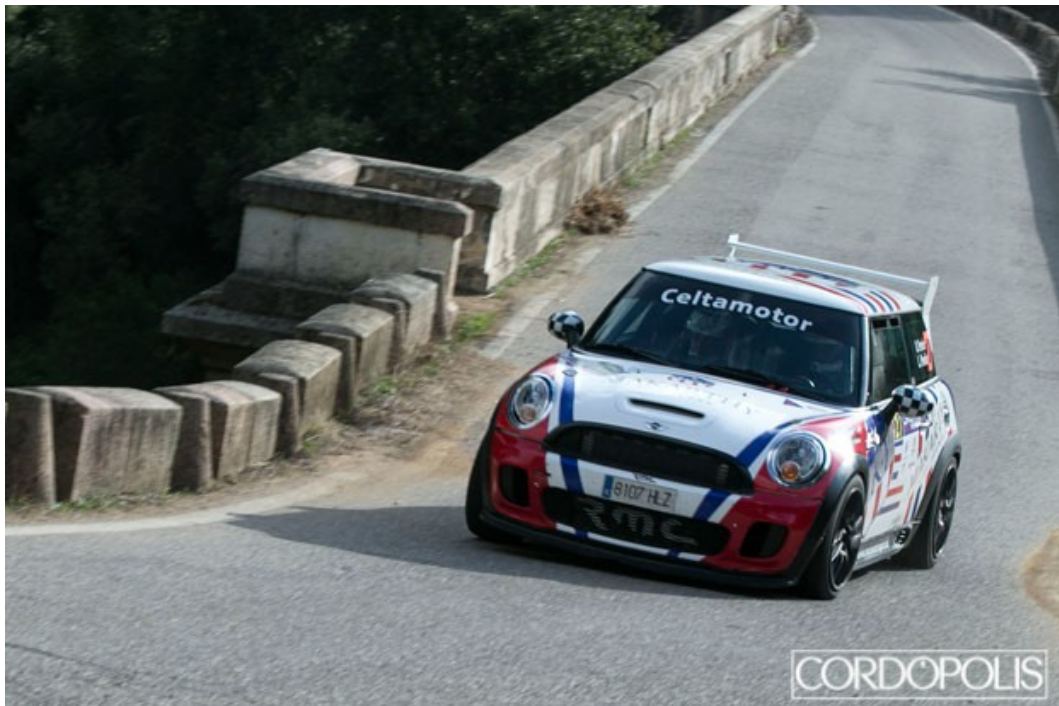
Oscar Pereiro : Año 2013