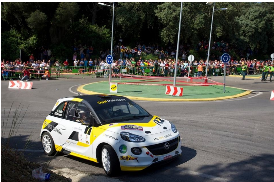
Vallin- Odriozola : Año 2014